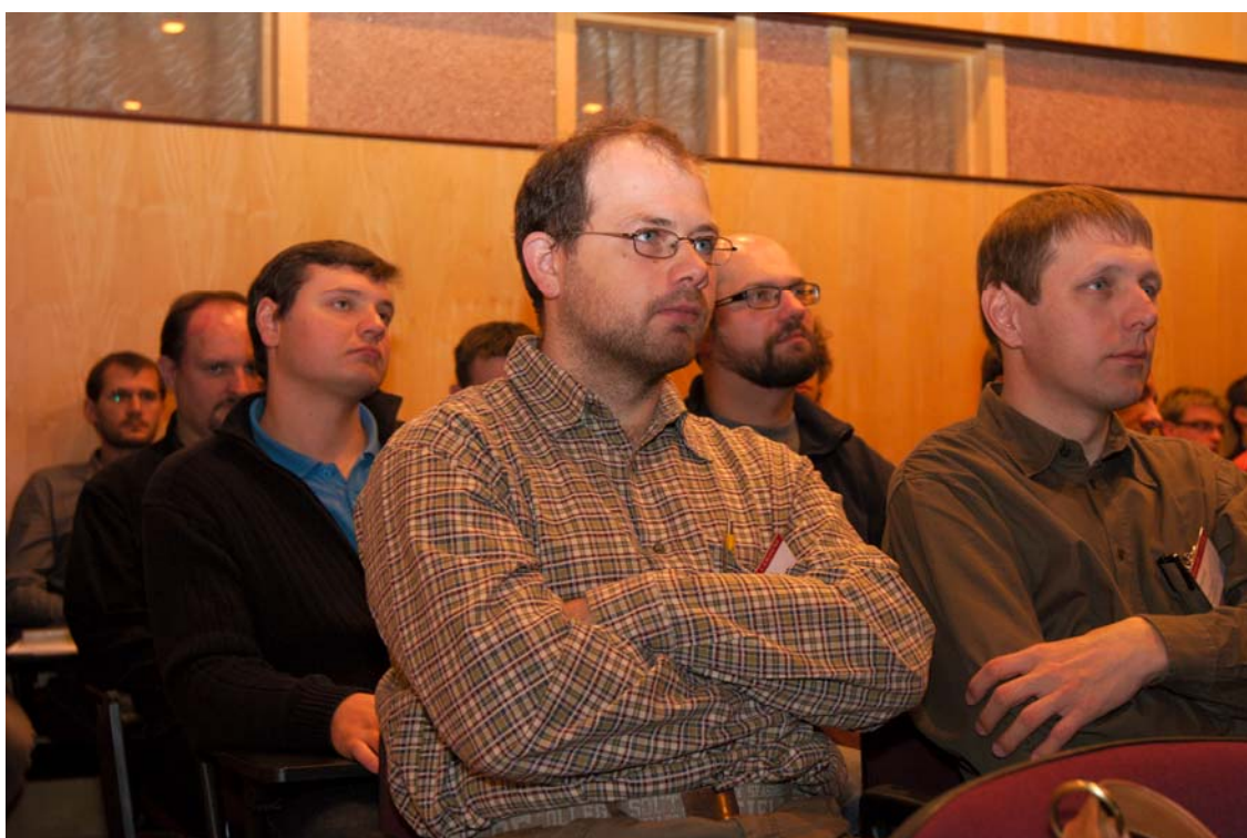
Většina přednášejících si dokázala udržet pozornost