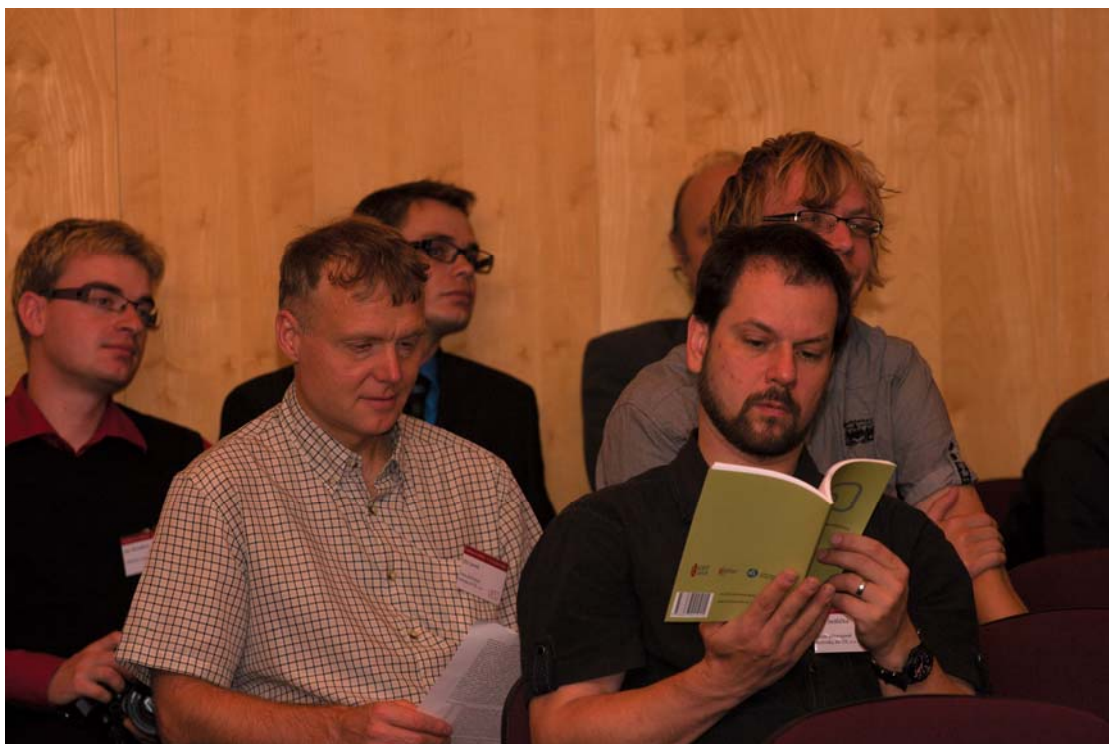
Účastníci si se zaujetím prohlížejí příspěvky kolegů ve sborníku