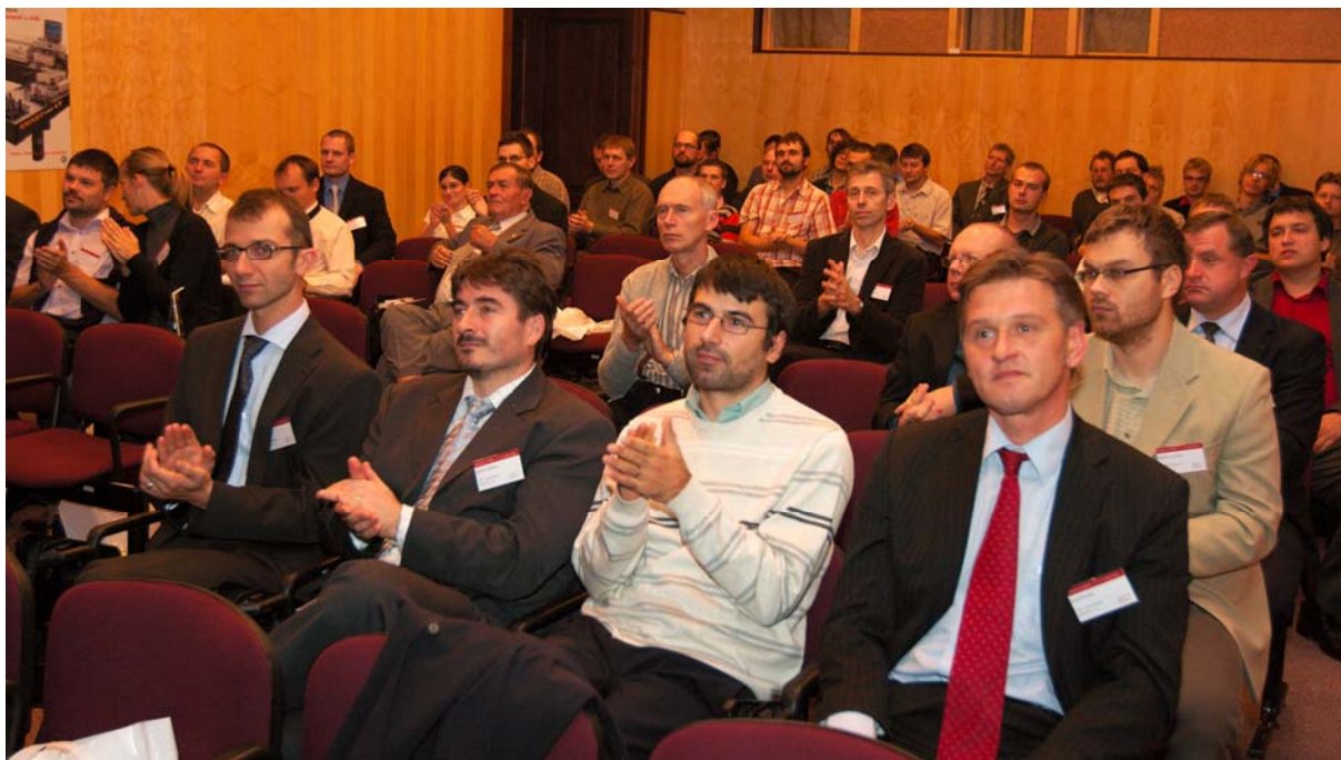
Auditorium odměňuje potleskem skvělé výkony svých kolegů